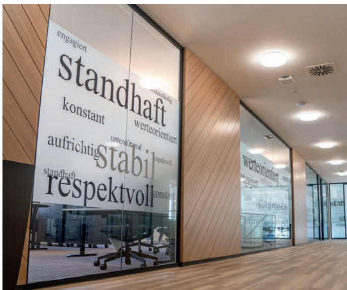
Die Volksbank Hochrhein eG stellt 2022 unter Beweis, wie exzellente, nachhaltige Beratungsqualität in Waldshut-Tiengen aussieht.

Die Volksbank Hochrhein eG erzielt den ersten Platz in Waldshut-Tiengen im größten und einzigen Bankentest mit umfassendem „Digital-Check“